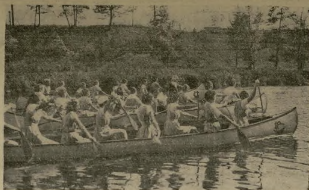
Las tripulaciones de canoas a "canaleta" del colegio femenino de Lasell durante una sesión de práctica en el Lago de Newton, Mass., en preparación para la regata anual escolar. Y siguen hablando de sexo débil...