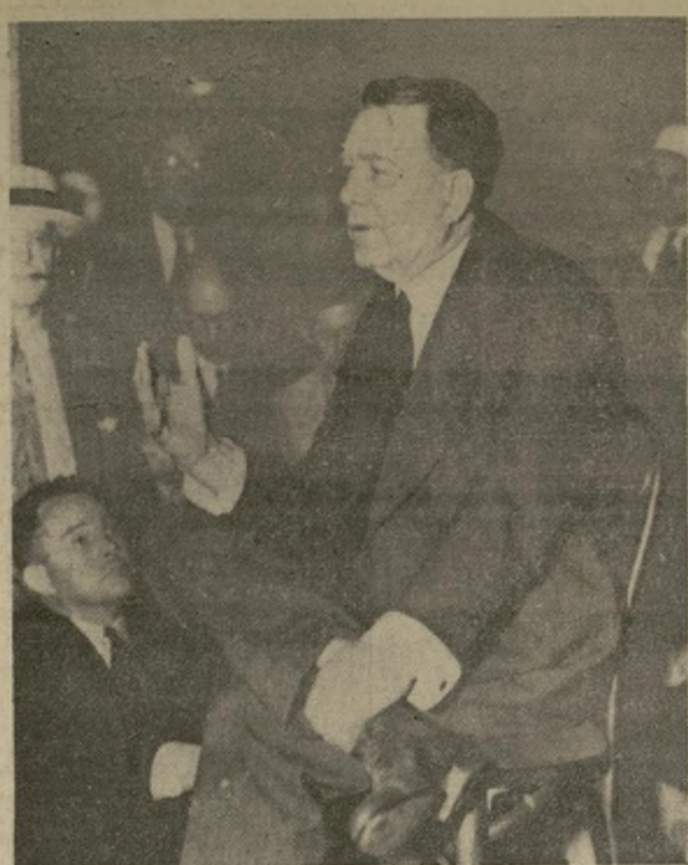
El senador William E. Borah, de Idaho, quien recientemente ha dicho que respaldará al candidato republicano a la presidencia si es que la plataforma que adopte el partido en la Convención Nacional es satisfactoria. Este ha venido haciendo campaña en contra de los monopolios.