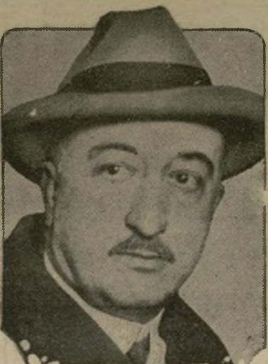
Doctor Orestes Ferrara