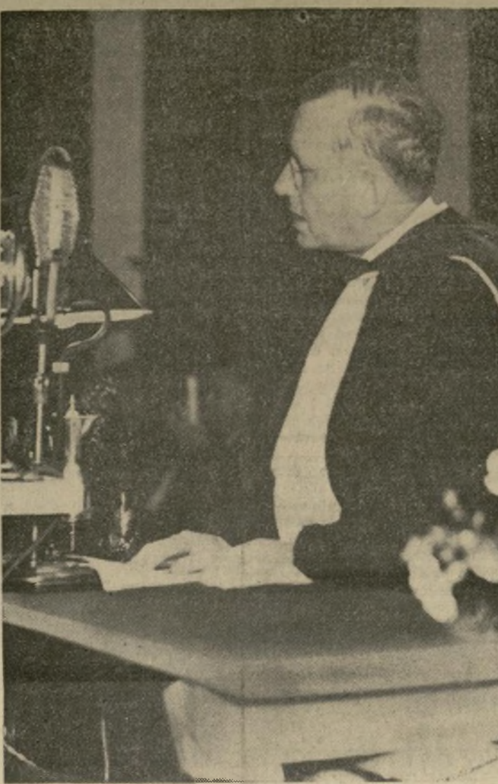
Alfred M. Landon, gobernador de Kansas, hablando en los ejercicios de graduación de la Universidad de dicho Estado, en cuyo discurso se manifestó en contra de la "tiranía del monopolio y la dictadura económica" en Estados Unidos.