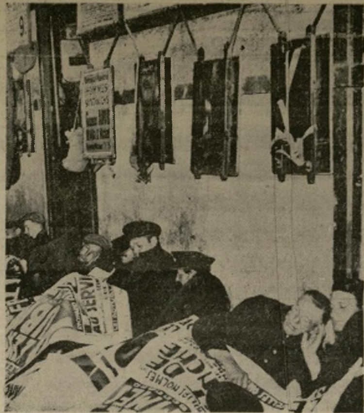
"Sandwich men" de la capital francesa que participaron en la epidemia de huelgas que dió origen al nuevo gobierno de "frente popular" de León Blum, duermen una siesta en sus oficinas generales usando anuncios y otro material impreso para cubrir sus cuerpos.