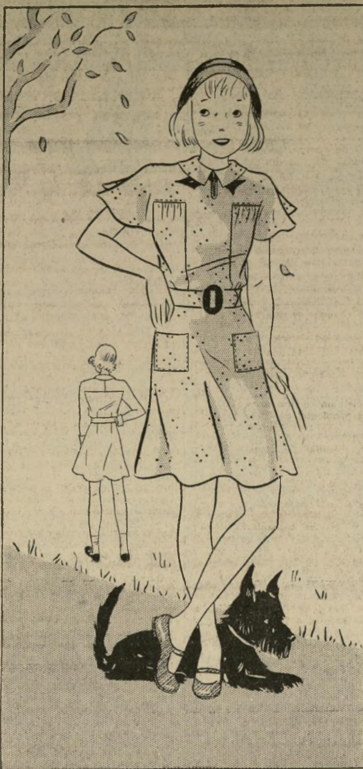
1699-B MODELO DE VESTIDO FRESCO PARA NIÑAS

1699-B.—Este figurín que hoy presentamos tiene un aire encantador, y satisface a la niña más exigente que le guste variar continuamente de estilo en el vestir. El canesú, las mangas y la pieza del frente, todo es de una pieza, imitando los vestidos de las personas mayores, y al mismo tiempo facilísimo para confeccionar.