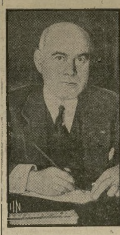
Gobernador Herbert H. Lehman

A PESAR DE SMITH, LOS DEMOCRATAS SIGUEN DECIDIDAMENTE PRO ROOSEVELT