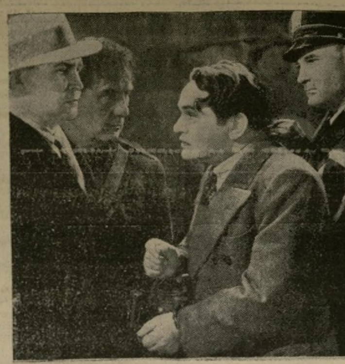
Edward C. Robinson (centro) y Barton MacLane (izquierda) cerebros directores del Trust del crimen, burladores de la ley sin contemplación de ningún género, en una serie de sucesos emocionantes en "Bullets or Ballots", la primera exposición nacional del crimen sindicado, que se ofrece en el Teatro RKO Regent, hoy.