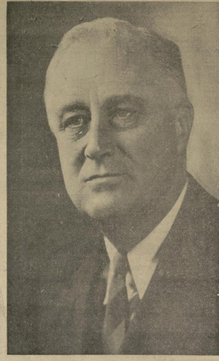
El discurso de postulación del "amigo de las masas," Mr. Franklin D. Roosevelt, por el Partido Demócrata para las elecciones presidenciales de noviembre, dió ocasión ayer a una de las más jubilosas demostraciones que se hayan registrado en una convención de partido en este país.