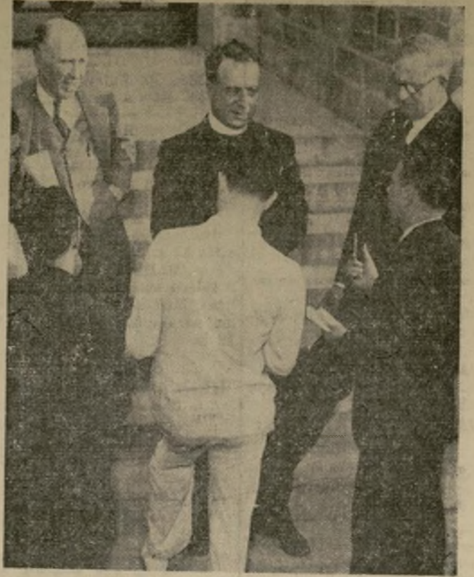
El representante Lemke (izquierda) y Thomas C. O'Brien, (derecha), candidatos a presidente y vicepresidente del nuevo Partido Unión, con el Padre Coughlin, entrevistados por los periodistas después de celebrar conferencia.