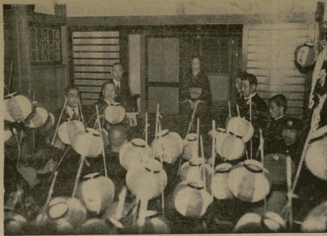
Una procesión con faroles llega a la residencia de la princesa Chikako Kuni, madre del emperador del Japón, en honor del nacimiento de Masahito Yoshi No Miya, segundo hijo del emperador y de la emperatriz.