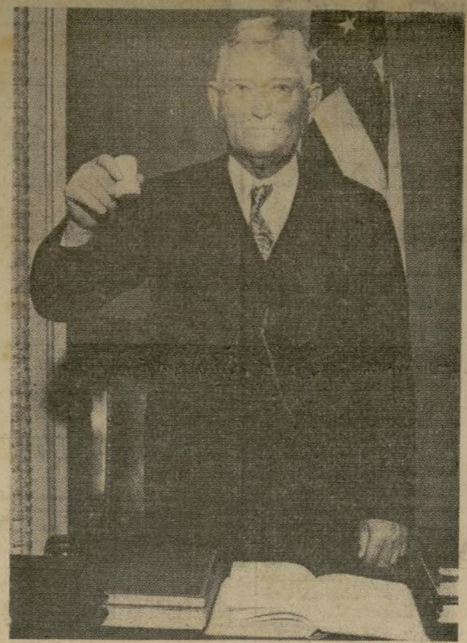
El vicepresidente John N. Garner, con el mallette usado en la apertura del primer congreso continental de los Estados Unidos, con el cual llamará a orden al 74.º congreso.