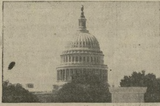
Washington, D. C., tarifas muy bajas de taxi.

30% DE LOS TAXIMETROS FUNCIONANDO BAJO LAS TARIFAS FENOMENALMENTE BAJAS EN LA CAPITAL SON PLYMOUTHS