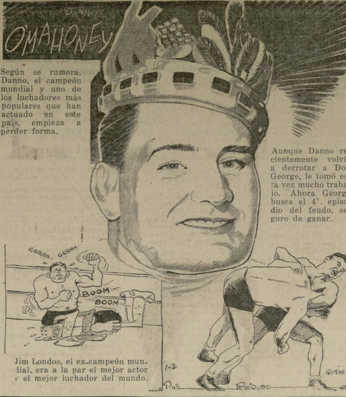
Jim Londres, el ex-campeón mundial, era a la par el mejor actor y el mejor luchador del mundo.

Según se rumora, Danno, el campeón mundial y uno de los luchadores más populares que han actuado en este país, empieza a perder forma.