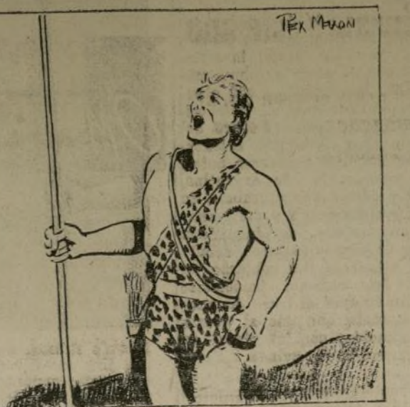
Copyright, 1935, by Edgar Rice Burroughs, Inc. Distributed by United Feature Syndicate, Inc.

Al llegar junto al borde de un empinado risco pedregoso, Tarzán detuvo a su prisionero, y le ordenó que se acercara junto al precipicio. Petrovich, descubriendo el abismo en la profundidad, retrocedió dominado por el terror imponente.