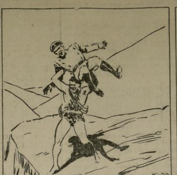
Copyright, 1935, by Edgar Rice Burroughs, Inc. Distributed by United Feature Syndicate, Inc.