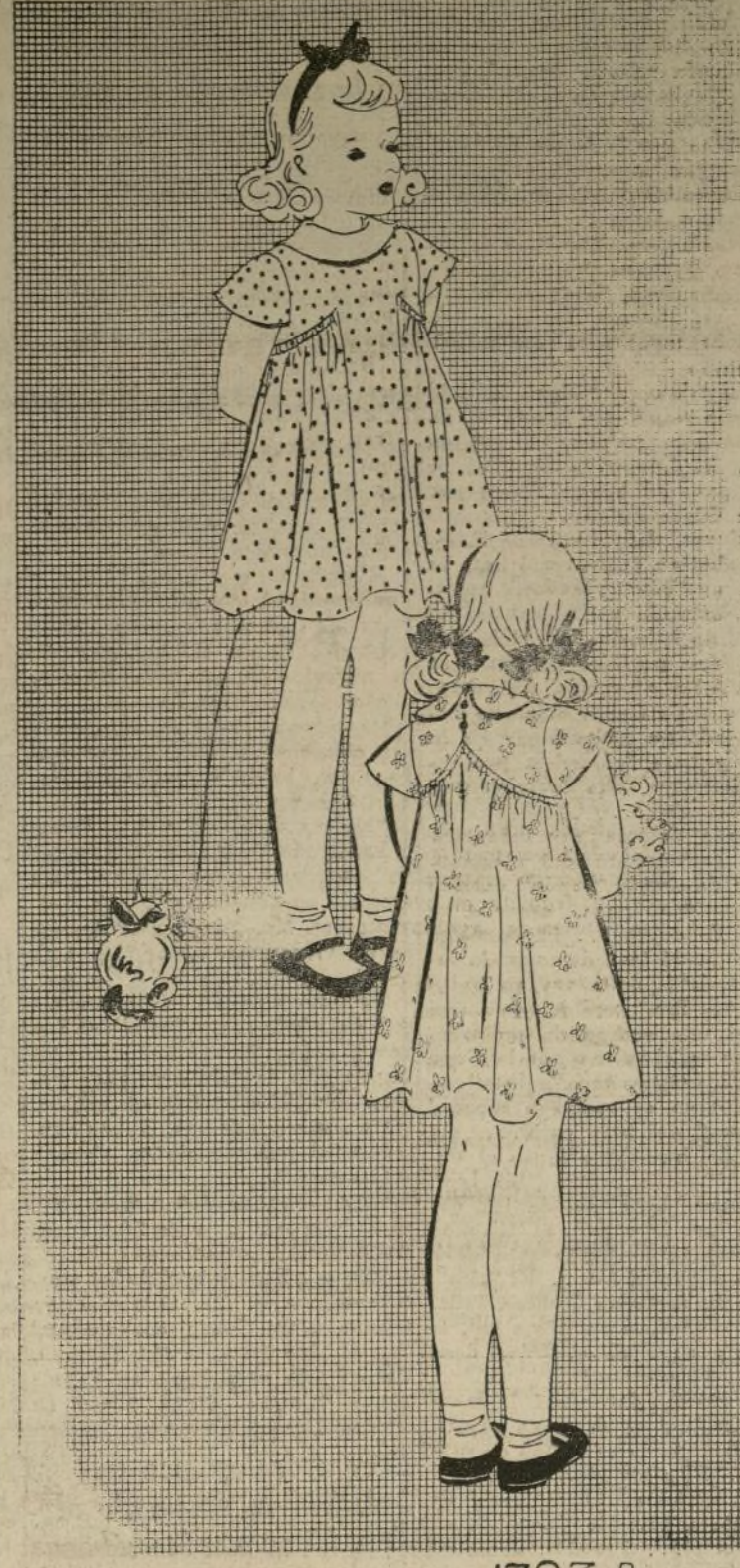
MONISIMO VESTIDO PARA NIÑA