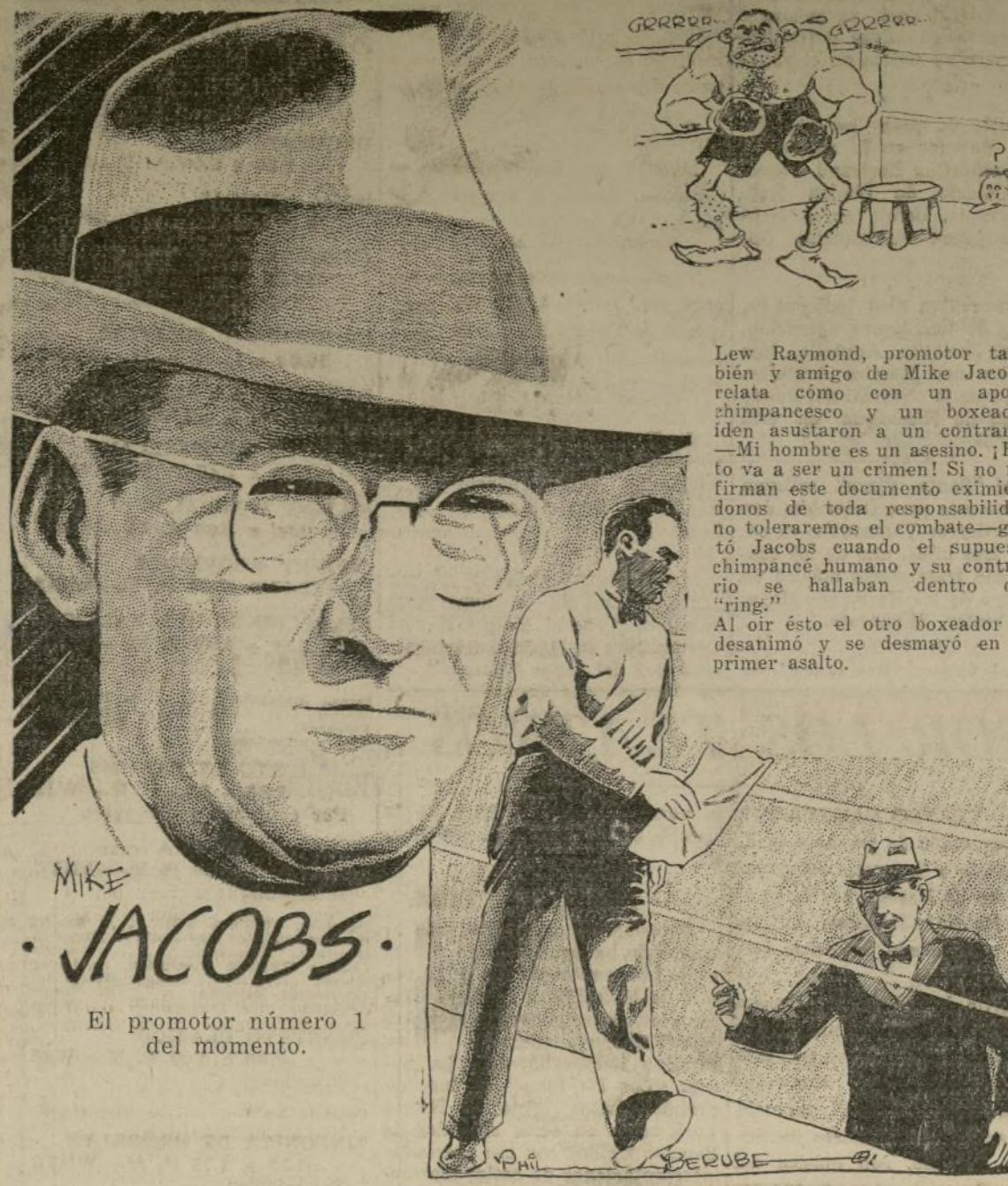
El promotor número 1 del momento.