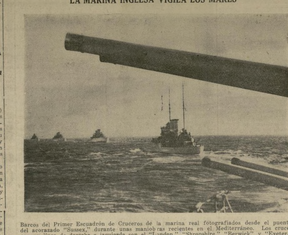
Barcos del Primer Escuadrón de Cruceros de la marina real fotografiados desde el puente del acorazado "Sussex", durante unas maniobras recientes en el Mediterráneo. Los cruceros, en línea de derecha a izquierda son el "London", "Shropshire", "Berwick" y "Exeter".