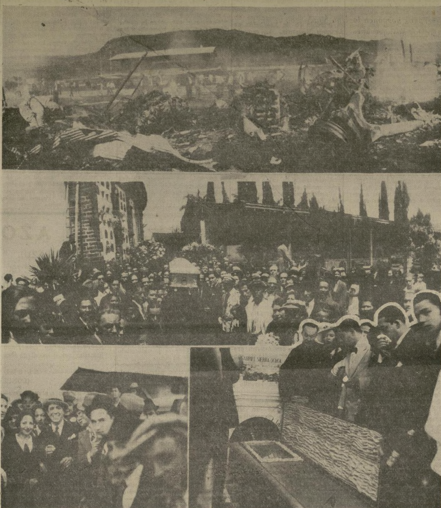
Arriba, escombros del trimotor de la Saco en que perecieron Carlos Gardel, el gran aviador colombiano Ernesto Samper y quince personas más. En el centro, los imponentes funerales del inolvidable cantante y actor argentino en la capital antioqueña. Abajo, izquierda, Gardel, rodeado de un grupo de admiradores y amigos, instantes antes de subir al trágico avión... ¿Cómo iba a imaginarse Gardel el pavoroso fin que le esperaba minutos después? Angulo inferior derecho, la exhumación del cadáver en el Cementerio de Medellín.