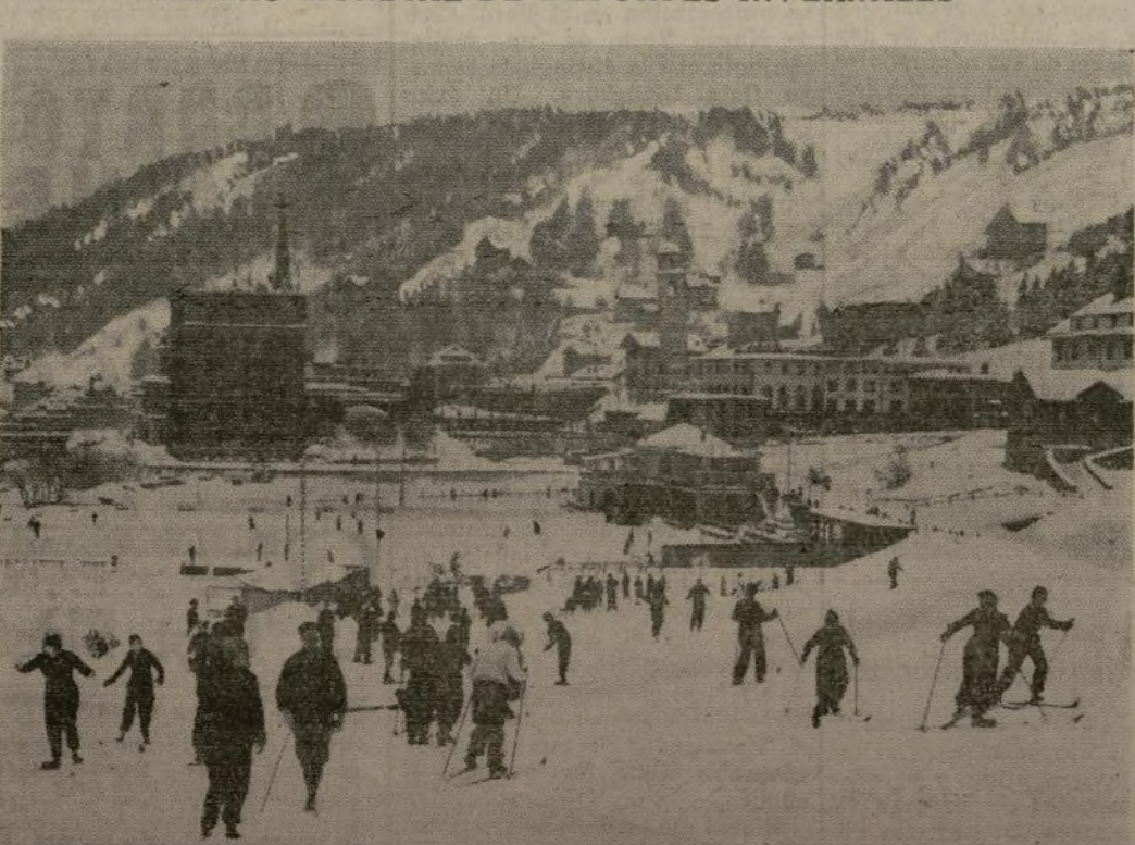
Vista tomada en St. Moritz, el más famoso de los centros de recreo invernales en los Alpes suizos, mostrando algunos de los hoteles y una de las pistas de patinaje. En el centro se divisa la torre inclinada de la iglesia.