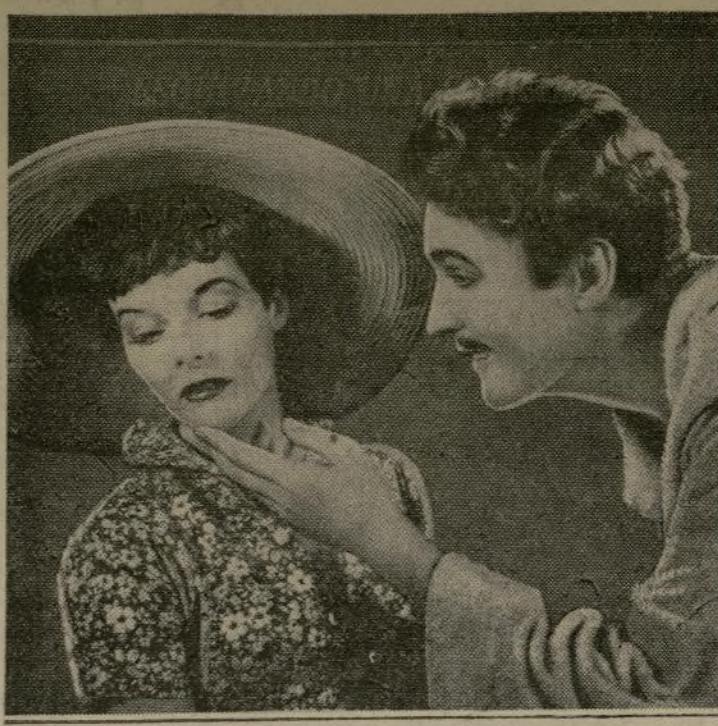
Katherine Hepburn, célebre estrella de la pantalla y de las tablas que toma parte, acompañada de Brian Aherne en la película "Sylvia Scarlett" que se exhibe actualmente en el Radio City Music Hall.