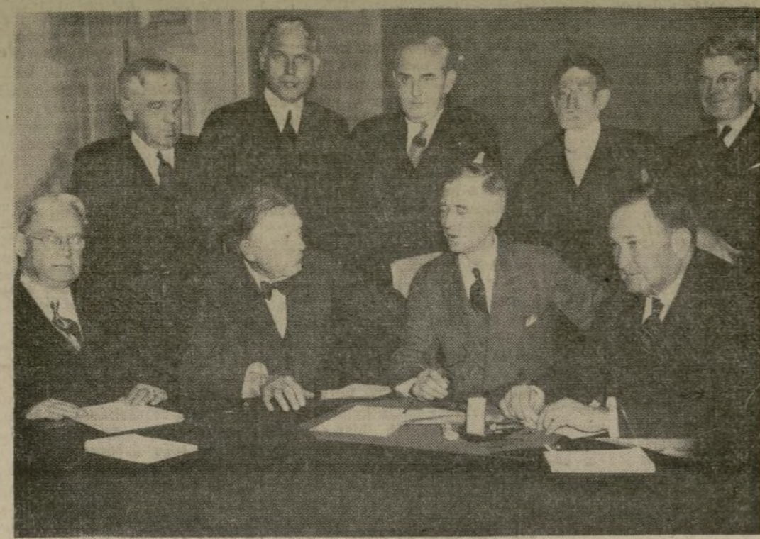
El Comité de Relaciones Exteriores del Senado conferenciando sobre legislación para mantener a los Estados Unidos alejados de las guerras. Sentados, de izquierda a derecha: senadores Johnson de California, Borah, de Idaho, Pittman de Nevada, presidente, y Robinson de Arkansas. De pie: White de Maine, Shipstead de Minnesota, Vanderburg de Michigan, Lewis de Illinois, y Duffy de Wisconsin.

Los monárquicos buscan 57 puestos Calvo Sotelo, que lleva la voz de los monárquicos, pide la presentación de 57 candidatos monárquicos, a lo que se niega Gil Robles. Además, los tradicionalistas, partidarios de don Alfonso XIII, quieren ocupar el trono, que en la actualidad de sus candidatos se hayan de presentar.