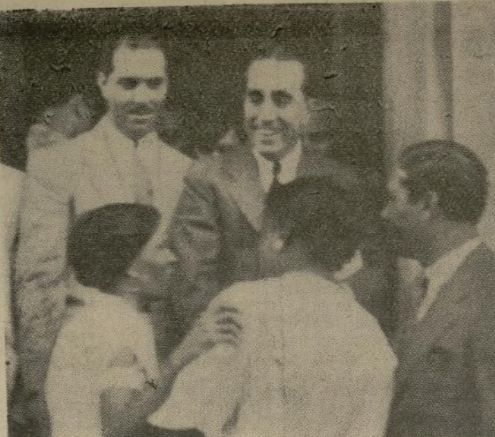
Dr. Miguel Mariano Gómez, candidato coalicionista a presidente de la república en las elecciones del viernes pasado, saliendo de uno de los colegios electorales en la Habana después de haber depositado su propio voto.

Dicese en Brasil que el centro rojo se ha ido a Méjico