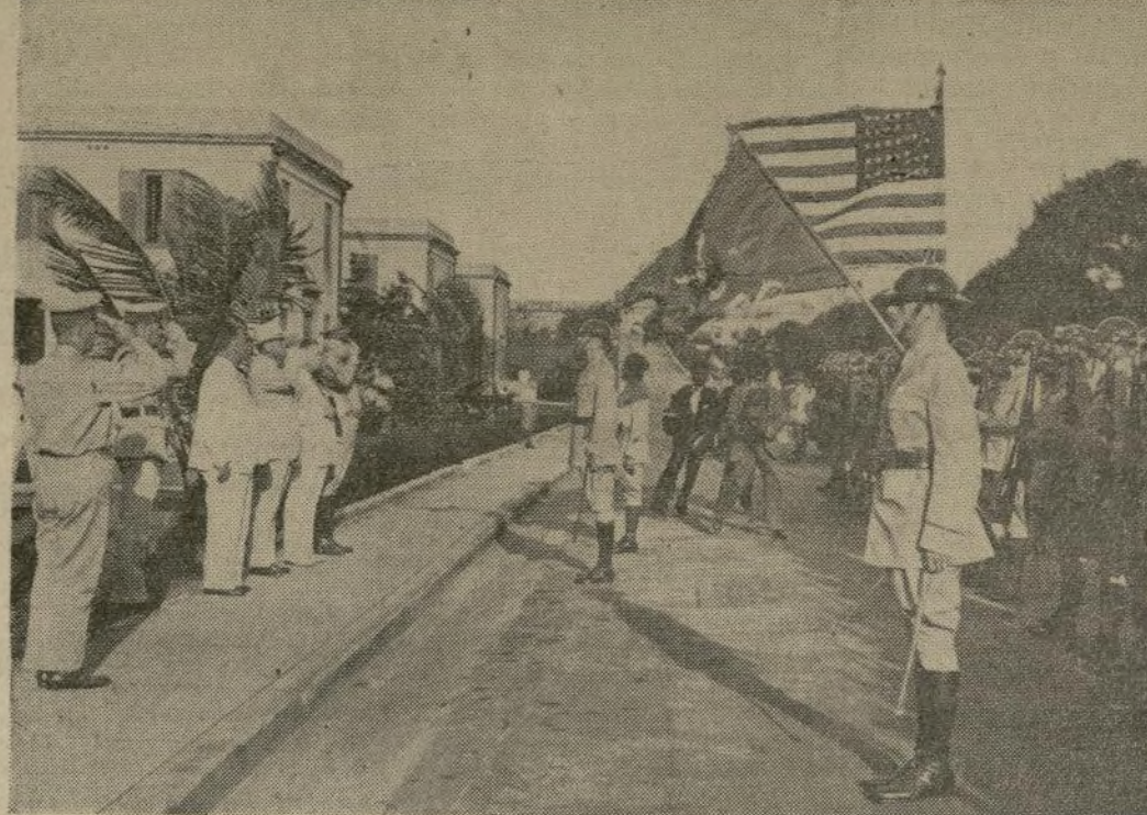
Se celebró, en honor al secretario del Interior, Harold Ickes, una revista militar en San Juan, Puerto Rico, una de las capitales por él visitadas en su viaje a dicha isla y a Islas Vírgenes, las dos posesiones de Estados Unidos en el Caribe. En el grabado aparece a la izquierda el secretario, acompañado por el gobernador Blanton Winship en el momento de saludar la bandera americana.