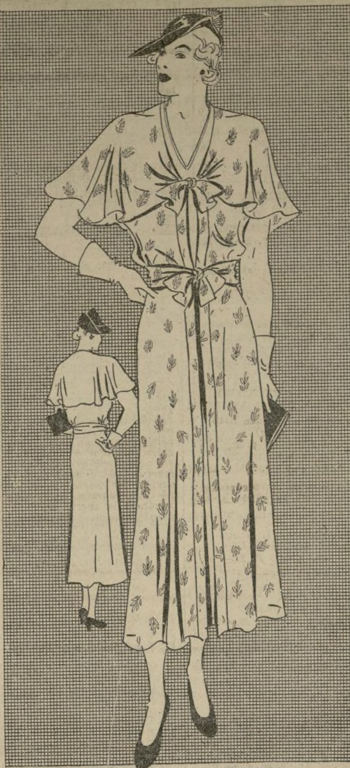
ELEGANTE MODELO PARA MATRONA

1807-B.—La mujer de silueta algo gruesa no puede aceptar fácilmente cualquier vestido que esté de moda. Hay que tener en cuenta que no todas podemos usar un tamaño 34 perfecto, ni que tampoco debemos acusar nuestras curvas acentuadas por medio de un vestido ceñido y que hay que tratar de ocultarlas con vestidos apropiados. El del diseño de hoy es ideal para la matrona de figura algo gruesa. Es además, un estilo sumamente confortable. La capa sienta graciosamente a la figura y está terminada con un lazo en el escote. El cinturón también termina con un lazo.