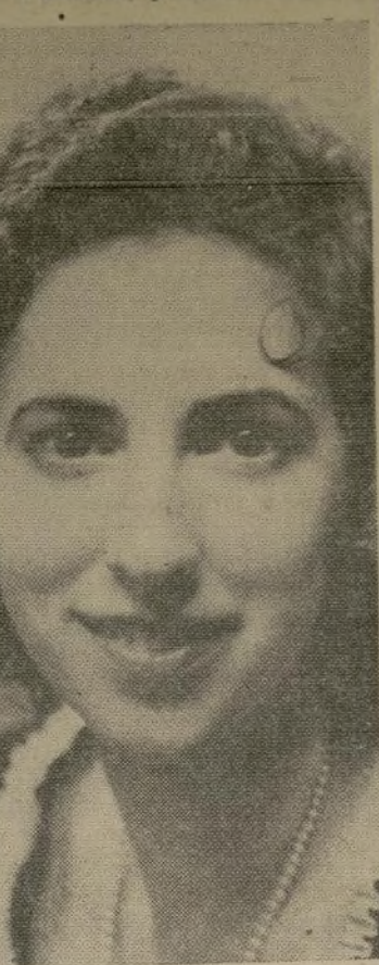
Miss Nathalia Crane

Esta celebrada poetisa norteamericana que, a pesar de su corta edad figura entre los autores de primera fila, dió su primer recital poético anteayer en la Brooklyn Academy of Music, ante un selecto y numeroso auditorio que mostraba conocer la importante obra literaria que ha realizado la señorita Nathalia Crane.