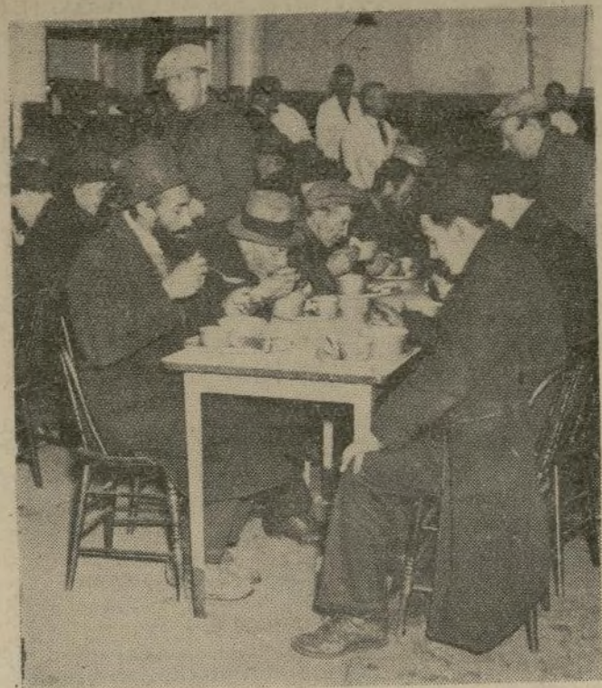
Hombres sin hogar, a quienes la repentina baja de la temperatura a dos grados bajo cero obligó a buscar albergue en los establecimientos gratuitos de hospedaje del municipio de Nueva York, consumen una comida caliente en una de esas casas en el barrio del Este.