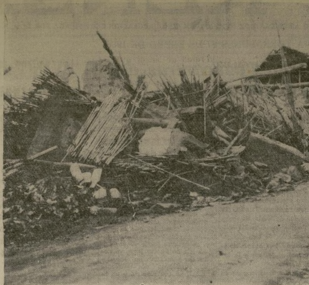
Ruinas de casas de Santa Ana después del terremoto y derrumbes que ocasionaron la muerte de centenares de personas en el Sur de Colombia. Más de 200 quedaron enterradas vivas a causa de los derrumbes en un solo pueblo de la región afectada.