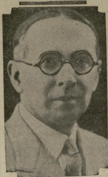
Presidente Alfonso López

En todo el país se observará un silencio de dos minutos, a partir de las 1.30 de la tarde.