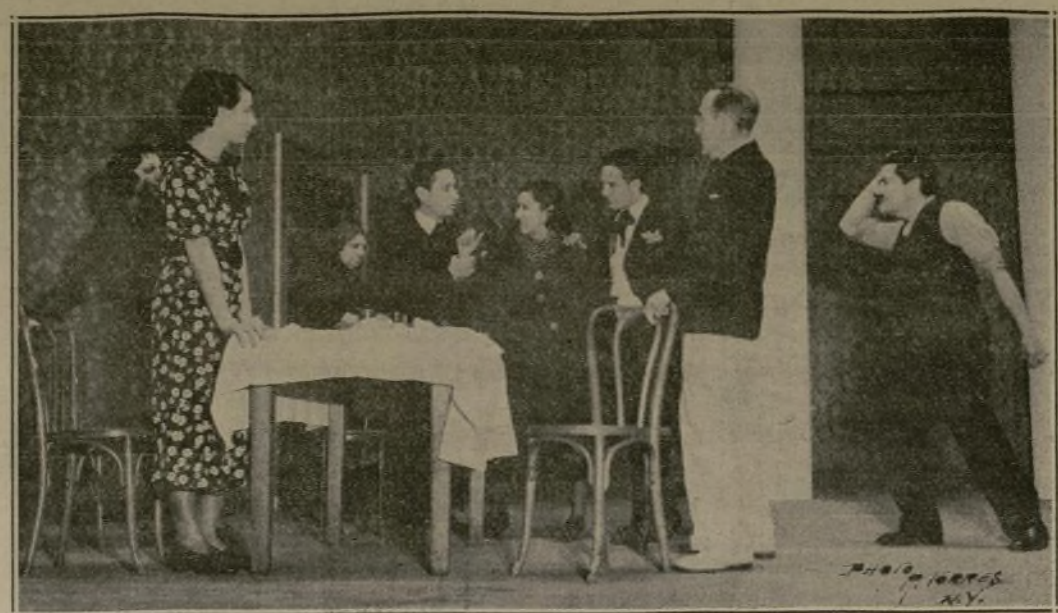
Escena final del primer acto en la comedia de don Jacinto Benavente "Cuando los hijos de Eva no son los hijos de Adán" que se pondrá en escena el domingo 2 de febrero en el Heckscher Theatre por una compañía dramática hispana.