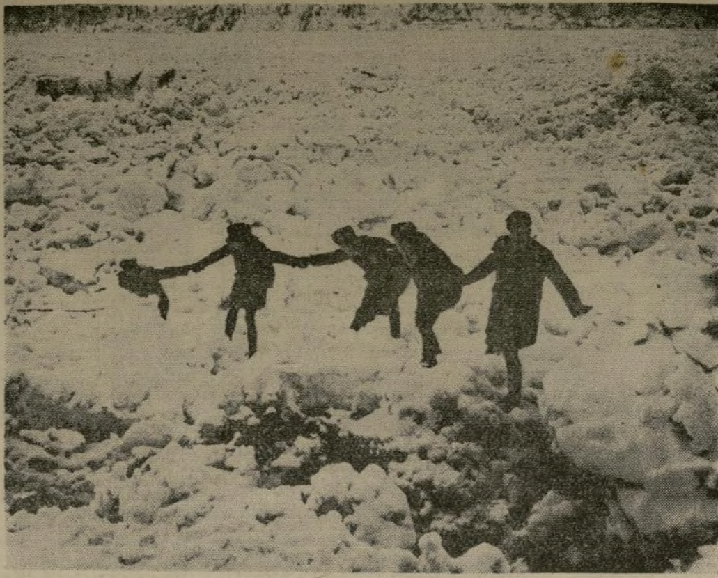
Miembros de una patrulla fronteriza forman una cadena sobre el hielo quebrado del Río Niágara, en Lewiston, N. Y., para salvar a un extranjero (extrema izquierda) que se cayó al río cuando intentaba cruzar desde los Estados Unidos.