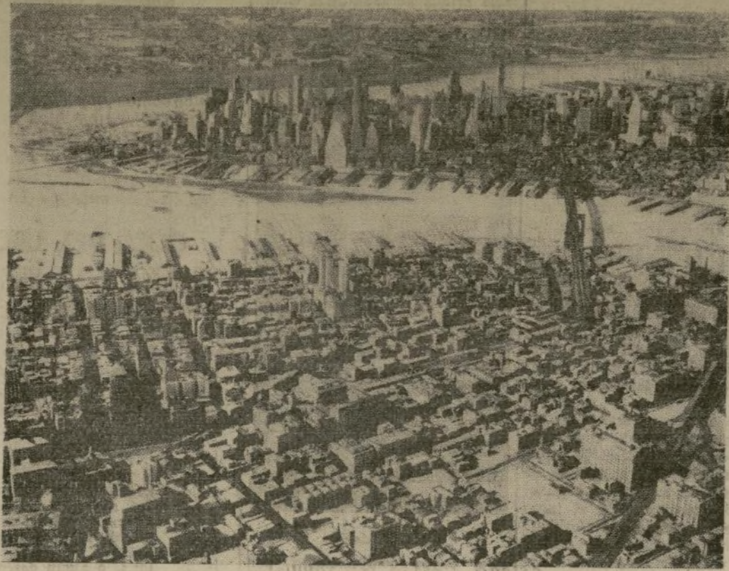
Vista aérea de la Isla de Manhattan, en donde aparecen el East River y el Hudson cubiertos completamente de trozos de hielo, algunos de ellos de gran tamaño, después de una semana de intenso frío.

EL INVIERNO INTERRUMPE EL TRÁFICO EN NUEVA YORK