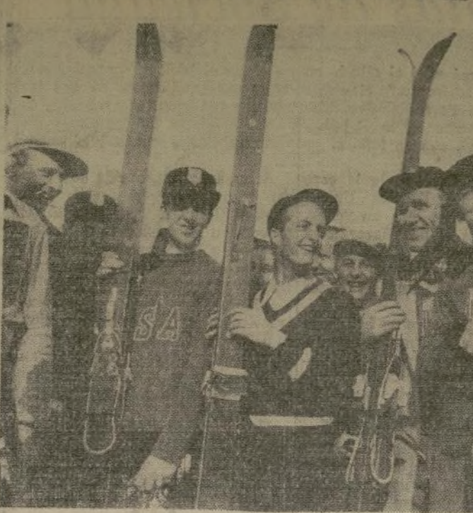
Miembros del equipo de esquiadores de los Estados Unidos llegan a Garmisch-Partenkirchen para tomar parte en los cuartos juegos olímpicos invernales en las montañas de Baviera.