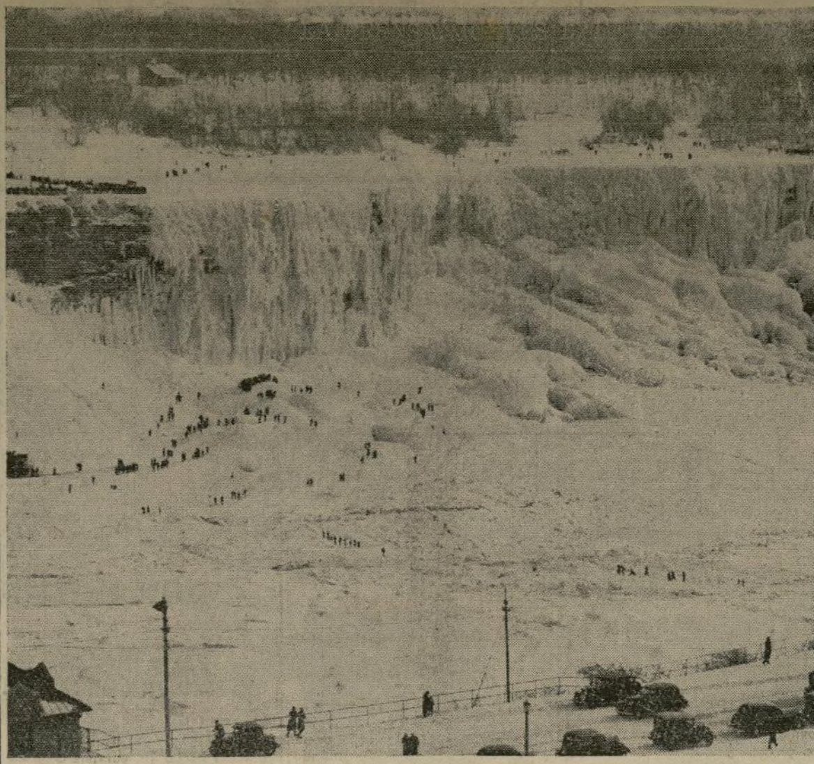
Las famosas cataratas, completamente heladas, permiten el paso del público de un lado al otro. El puente de hielo de abajo, sin embargo, se encontró que estaba formado por una capa delgada que pudo haber puesto en peligro la vida de los que caminaban sobre él.