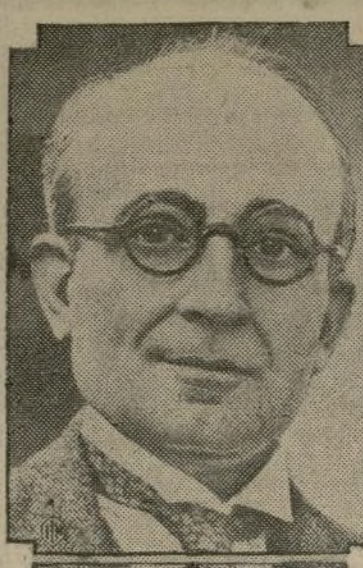
Don Salvador de Madariaga