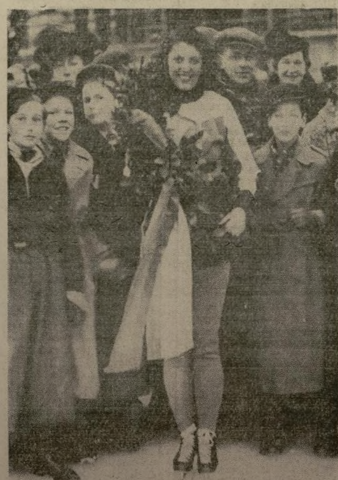
Miss Kit Klein, de Buffalo, N. Y., conquistó recientemente el campeonato mundial femenino de velocidad en Estocolmo, ganando holgadamente las pruebas de 500 metros, 1,000 metros, 3,000 metros y 5,000 metros. He aquí a la linda vencedora con un ramo de flores que le fué presentado por un grupo de admiradores.