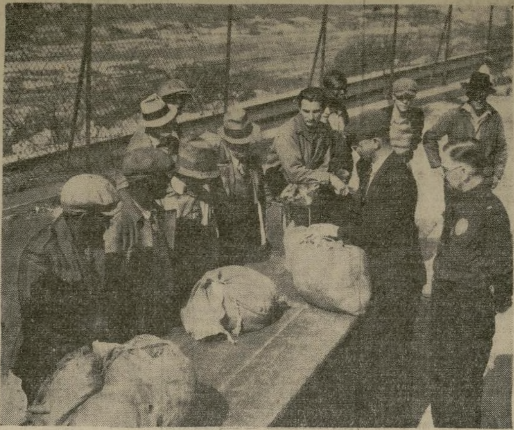
Miembros de un grupo especial del Departamento de Policía de Los Angeles inspeccionan el equipaje de unos cuantos vagos detenidos al emprender la campaña contra forasteros indeseables. Estos recibieron órdenes de salir inmediatamente o exponerse a pasar 10 días en la cárcel.

Los socialistas lo anuncian ya como un plan preparado