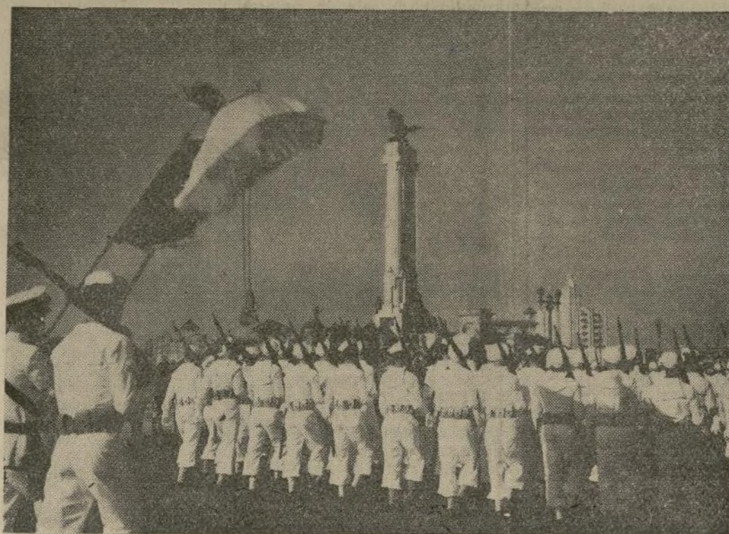
Marineros cubanos desfilando frente al monumento en el Malecón de la Habana, en el aniversario del hundimiento del barco americano, preludio de la guerra entre los Estados Unidos y España y de la independencia de Cuba.