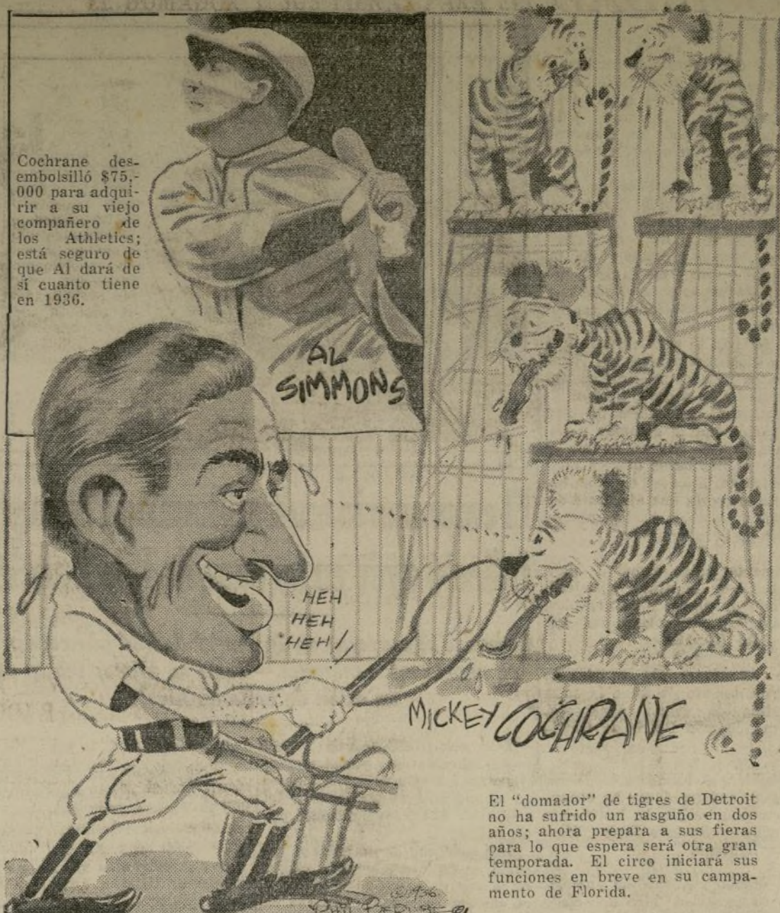
El "domador" de tigres de Detroit no ha sufrido un rasguño en dos años; ahora prepara a sus fieras para lo que espera será otra gran temporada. El circo iniciará sus funciones en breve en su campamento de Florida.