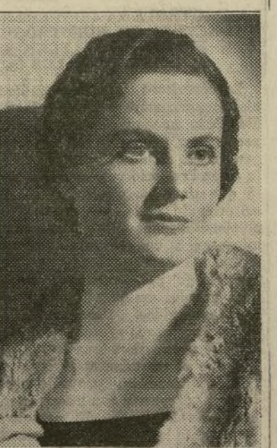
FRIEDA INESCORT En su último éxito, en la producción de Samuel Goldwyn "The Dark Angel"

¡He aquí un secreto de Hollywood! La mayoría de las bellísimas estrellas beben leche... porque la leche les permite retener su energía sin añadir peso a su figura.