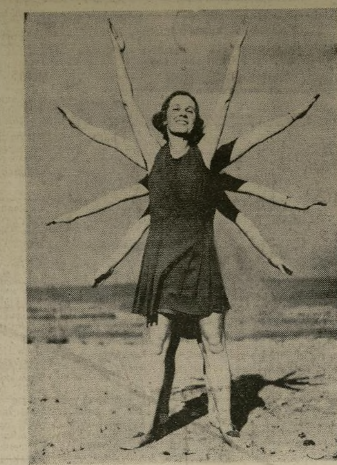
Miembros de una clase de ejercicios calisténicos en la playa de Margate, famoso balneario de los londinenses en la costa sur de Inglaterra, practicando la "docena diaria" para adelgazar.