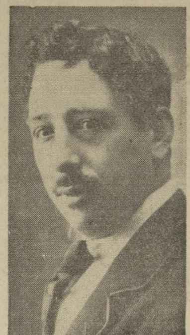
Don Luis Companys

Figuran entre ellos varios ex oficiales supuestamente ibañistas.—Alessandri convoca al Congreso a sesión extraordinaria para hacer frente a la situación.—Se echa la culpa a los elementos radicales.