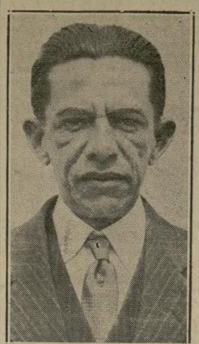
Doctor Harmodio Arias

Panamá presentó objeciones, a- legando que esta concesión especí- fica de derecho de intervención ya no tenía razón de ser bajo las (Sigue en la sexta página)