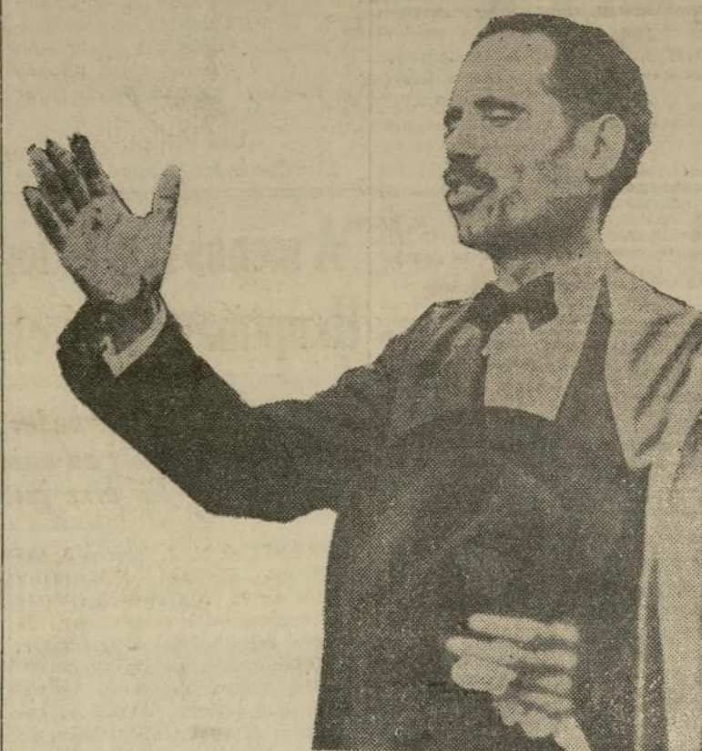
LCDO. ALBIZU CAMPOS

Ickes dijo que no se dará más ayuda federal a Pto. Rico