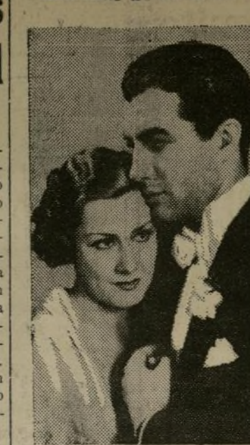
Irene Dunne y Robert Taylor, protagonistas de la película "Magnificent Obsession", una producción de la casa Universal, que exhibe el teatro Jewel, desde hoy hasta el martes entrante.