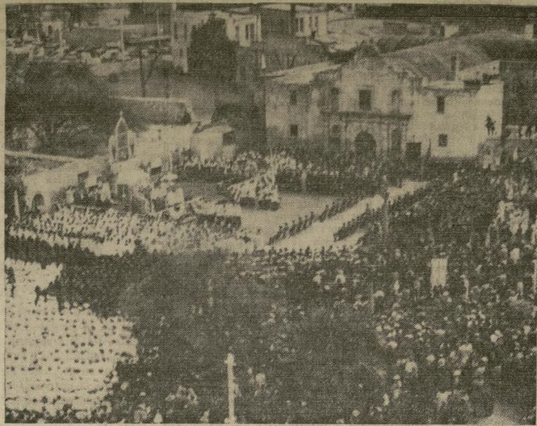
Una misa mayor es celebrada en la antigua misión de el Alamo, en San Antonio, en conmemoración del centenario de su caída, cuando, después de un sitio de trece días, los hombres de Santa Anna entraron al recinto y encontraron a todos los defensores de la guarnición muertos.

LOS HABITANTES DE TEXAS CELEBRAN SU INDEPENDENCIA