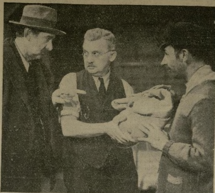
Esta es una escena de la película "The County Doctor," producción de la casa Fox, que se empieza a exhibir hoy en el Radio City Music Hall. En esta película toman parte las célebres mellizas Dionne que nacieron en Canadá.