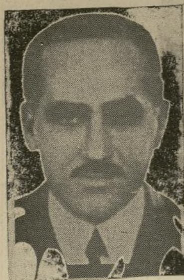
Sr. Amos Salvador Ministro de la Gobernación

Triles y monjas huyen de España remiendo violencias. Una de ellas la que asaltó un tren de lunes. Maestros de Nayarit escapan de ser linchados—Méjico ofrece comprar sus tierras a las menonitas.