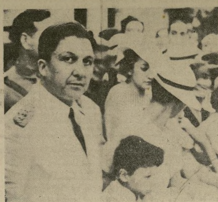
Colonel Rafael Franco, héroe de la guerra del Chaco, que ha implantado un régimen "totalitario" en Paraguay tomando como modelo a los anteriores dictadores de su país y adoptando algunas fases del fascismo y del nazismo europeos. Su gobierno ha sido ya reconocido por los Estados Unidos y otras naciones del continente.