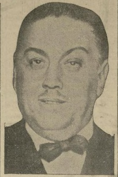
Don Diego Martínez Barrio