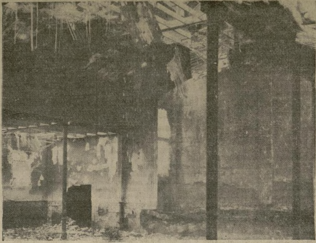
Escuela católica después del incendio causado en uno de los desórdenes comunistas que formaron parte de la reñida lucha entablada entre derechas e izquierdas desde que se celebraron las últimas elecciones.

OBRA DESTRUCTORA DE ANTICLERICALES EN ESPAÑA