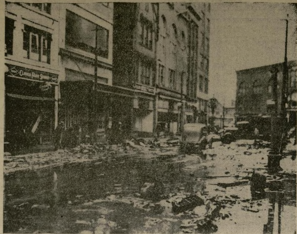
Johnstown, Penna., da comienzo a la limpieza de escombros y lodo dejados por la inundación que hizo vivir de nuevo a algunos de sus habitantes los angustiosos días de 1889 cuando la ciudad fue destruida y dos mil personas murieron ahogadas.