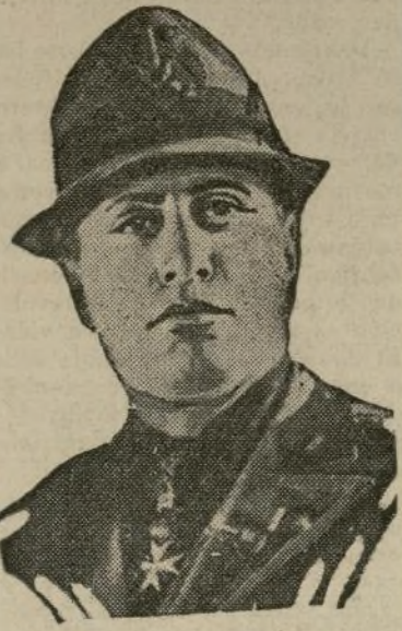
Sr. Benito Mussolini