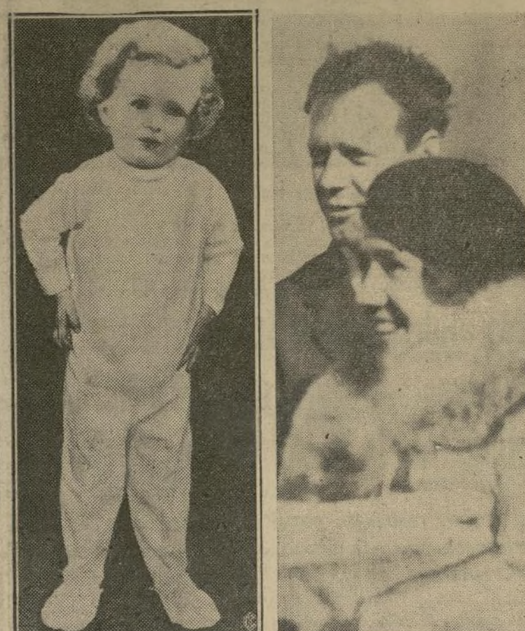
El niño Lindbergh, inocente víctima del pavoroso crimen que conmovió al mundo, y sus padres el coronel Charles A. Lindbergh y Anne Morrow Lindbergh. Con la muerte de Hauptmann se habrá castigado al verdadero y único culpable del secuestro y muerte del "aguilucho".