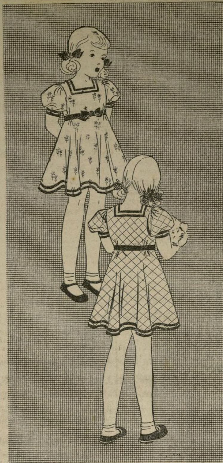
MONISIMO VESTIDO PARA NIÑA