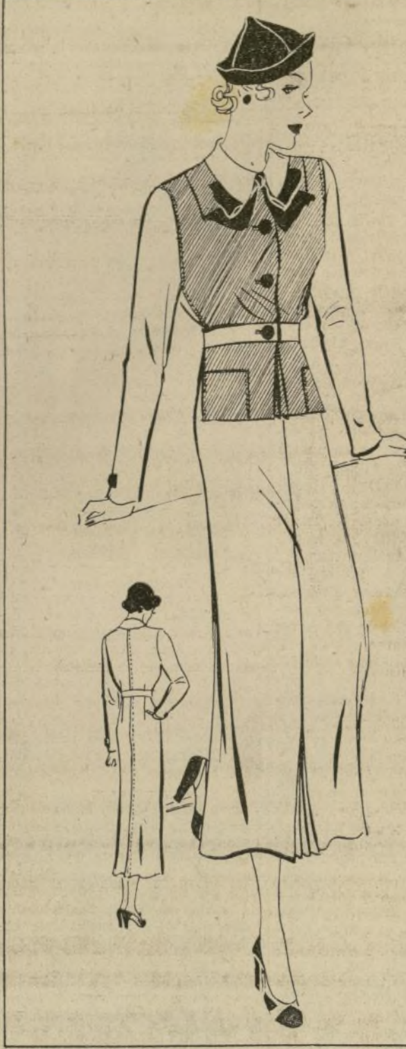
ELEGANTE TRAJE PARA DEPORTES

LIBRERÍA DE SU GORDURA. La Prescripción O. B. C. T. de Kelen ha ayudado a reducir a miles de libras, dietas o pautas de ejercicio. Prescripción. Para 6 días $1. Devolvemos dinero si no queda satisfecho. GRAY'S DRUG STORE. Broadway y 43rd St. Atendemos órdenes por correo.