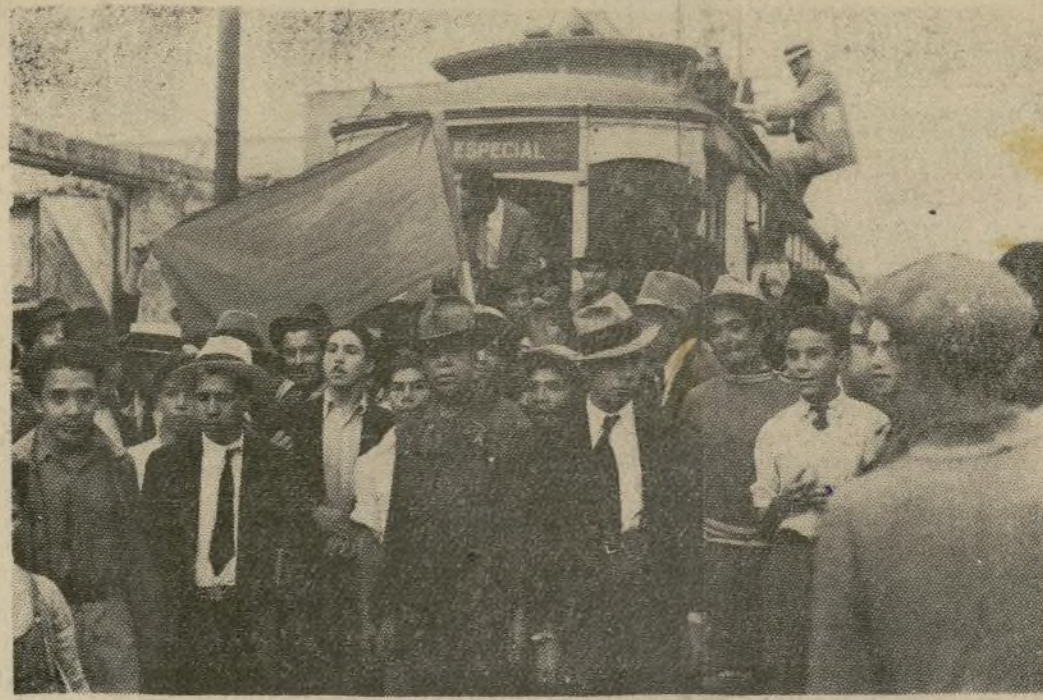
Tranviarios en huelga en el Distrito Federal de Méjico reciben a un motorista que ha hecho su último viaje de regreso a los depósitos con la bandera roja enarbolada en la parte de adelante de su tranvía. Una huelga de solidaridad en otras ciudades mejicanas ha sido anunciada.