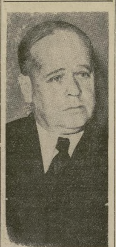
Frank C. Walker, de Nueva York, quien posiblemente será nombrado coordinador personal por el presidente Roosevelt, para administrar los $4,880,000, 000 asignados en el proyecto de socorro y obras públicas.