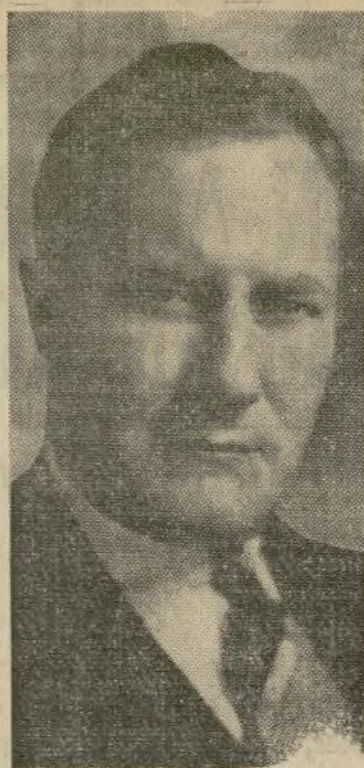
Spruille Braden, de New York, uno de los principales líderes en los círculos chileno-americanos, formará parte de la delegación estadounidense a la conferencia comercial panamericana de Buenos Aires que se inaugurará el 26 de mayo.