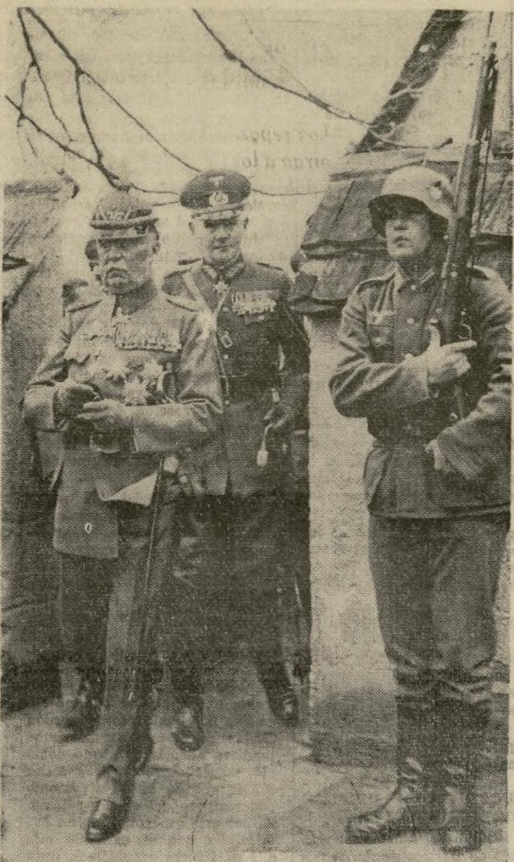
El general Erich Ludendorff, a quien sigue el general von Blomberg, vistiendo su uniforme de los días de la guerra y luciendo sus condecoraciones el día de su cumpleaños, que fue motivo de una celebración militar por haber implantado el Führer Hitler el servicio obligatorio que coloca a Alemania, al menos teóricamente, al nivel de las demás potencias.