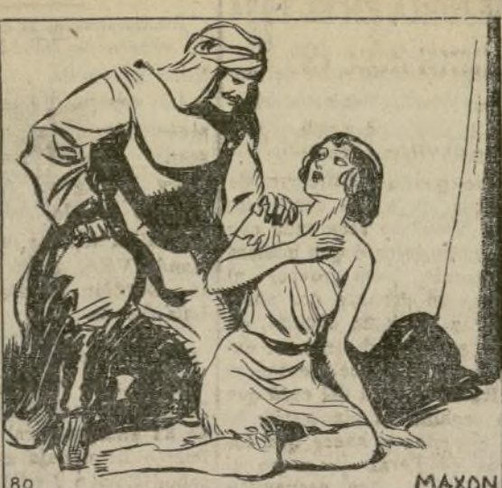
Copyright, 1935, by Edgar Rice Burroughs, Inc. All rights reserved.

Mariem permaneció temblando frente al Jeque. Los años y el traje no podían haberla transformado tanto para que la conociera en su adolescencia. Se horrorizaba cuando pensaba en que al cabo de tantos años el destino la colocaba de nuevo en manos de aquel villano jefe del desierto. Adelantándose hacia la atemorizada Mariem, el cruel villano la agarró fuertemente por un brazo, rugiendo en tono de cinica satisfacción: "¡Al fin has vuelto a tu antiguo amo...!"