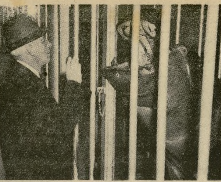
El exgobernador Alfred E. Smith hace una visita nocturna al jardín zoológico del Parque Central de Nueva York y obsequia a "Rosie", hipopótamo hembra, un puñado de manzanas. Después de su visita anterior él cobró sus diez centavos, mitad del salario anual que gana por tener un ojo puesto sobre el zoológico después del anochecer.