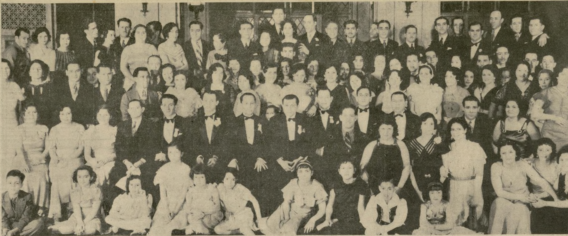
Asistentes al "Baile de Primavera" celebrado por esta agrupación borinqueña de Brooklyn, el sábado, en el