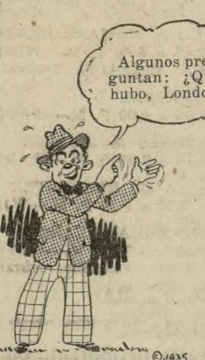
"El Lobito" es un verdadero "espectáculo" con sus flamantes vestidos.