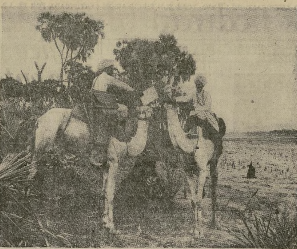
Jinetes de un cuerpo nativo de camelleros, en servicio de mensajería, cambian despachos en una región deshabitada de Eritrea, colonia italiana que limita con Abysinia a donde Mussolini envió refuerzos militares cuando se ocasionó la crisis a causa de incursiones a través de las fronteras.