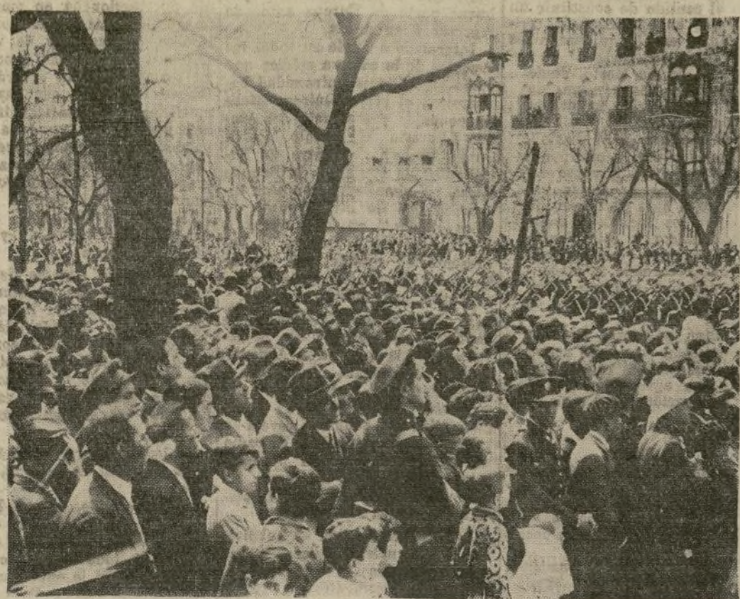
Tropas de la guarnición de la capital desfilando por el Paseo de Recoletos durante la celebración del cuarto aniversario del establecimiento de la república española.

MADRID FESTEJA EL ANIVERSARIO DE LA REPÚBLICA