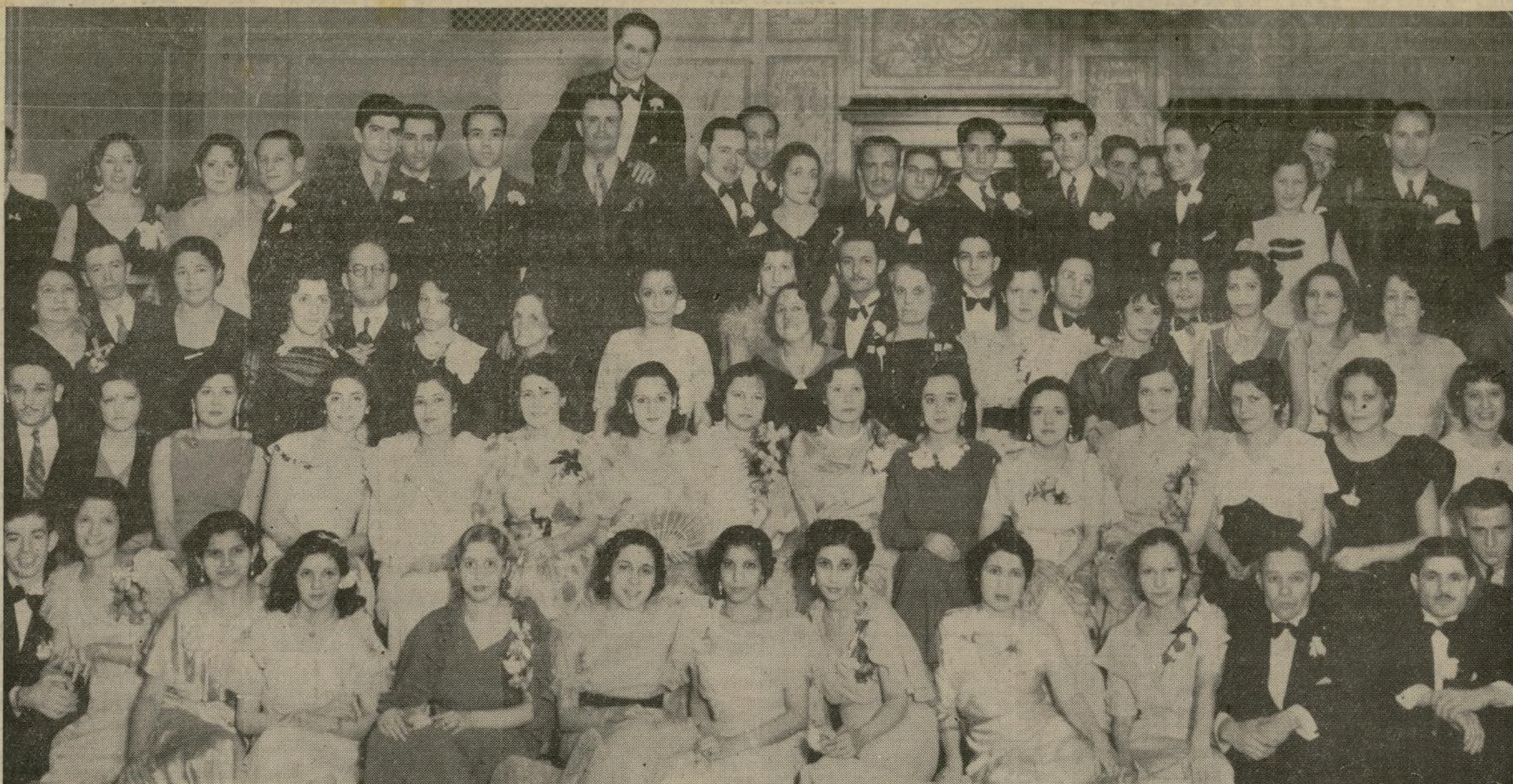
Selecta concurrencia asistió al festival bailable celebrado por estas damitas de La Milagrosa, el sábado en el Hotel Taft, anotándose un triunfo en su primer velada. Una magnífica marimba deleitó a los reunidos y también se dió un número de variedades por artistas nuestros. Todo se desarrolló dentro del más agradable ambiente social, y las organizadoras que se aproximan a cen-