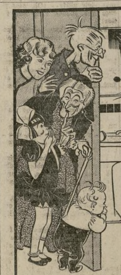
LOCOS de amarar no soy, porque canto en las mañanas, aunque los chicos de Eloy, con la abuela y las marianas, pegados a las ventanitas, digan que loco lo soy.

Los funcionarios franceses abrigaban la esperanza de que los informes de Berlín sobre la construcción de "submarinos de bolsillo", como se les llama aquí, constituyan la respuesta directa de Alemania a la unión de Inglaterra con Francia e Italia alcanzada en Stresa, la que Francia, está dispuesta a preservar por todos los medios posibles.