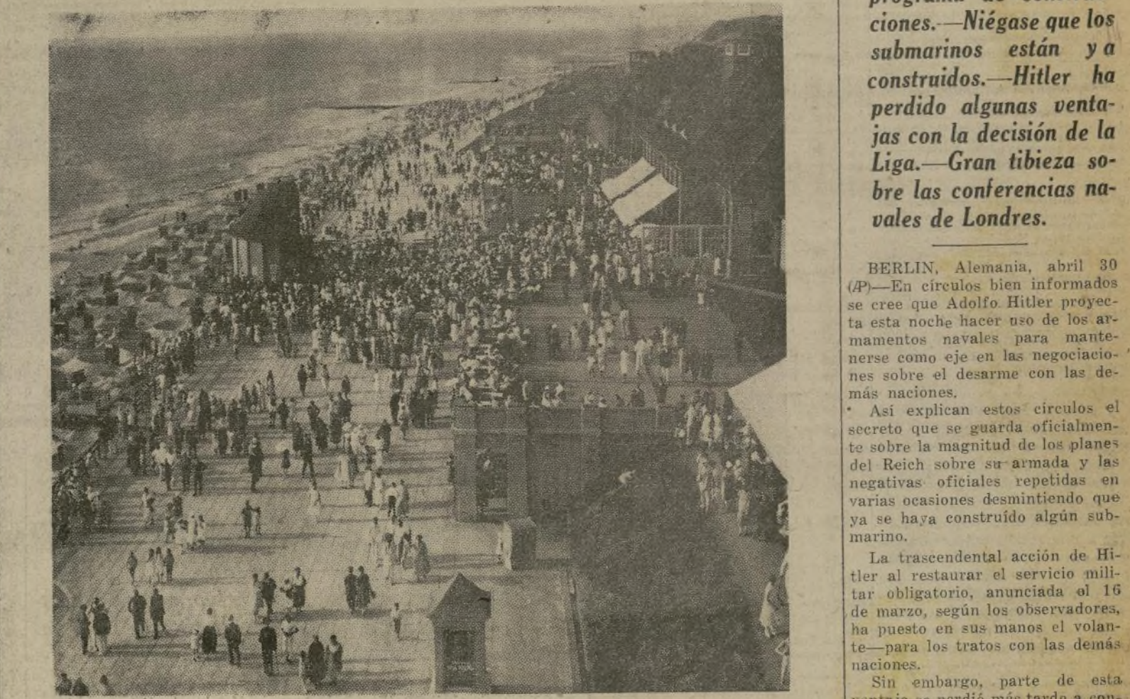
Vista de la isla de Sylt, a solo 425 millas de Londres, al norte del canal de Kiel, la que según informes publicados en París ha sido dotada de grandes fortificaciones y constituida en base de submarinos y aviones.