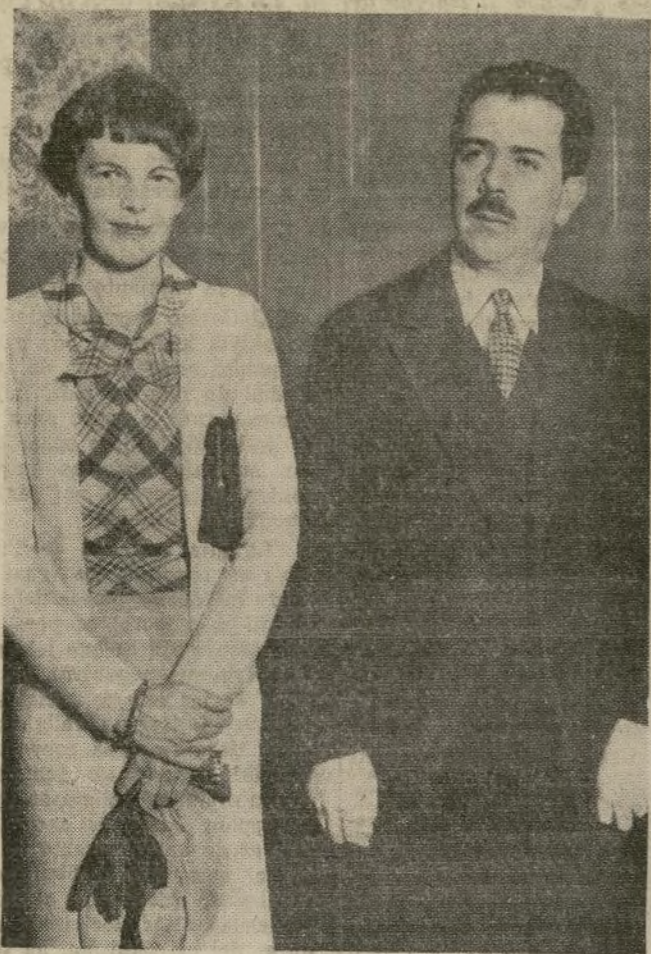
Amelia Earhart, única mujer que ha volado a través de los océanos Pacífico y Atlántico visita al general Lázaro Cárdenas, presidente de México, después de su vuelo de buena voluntad desde Burbank, California.