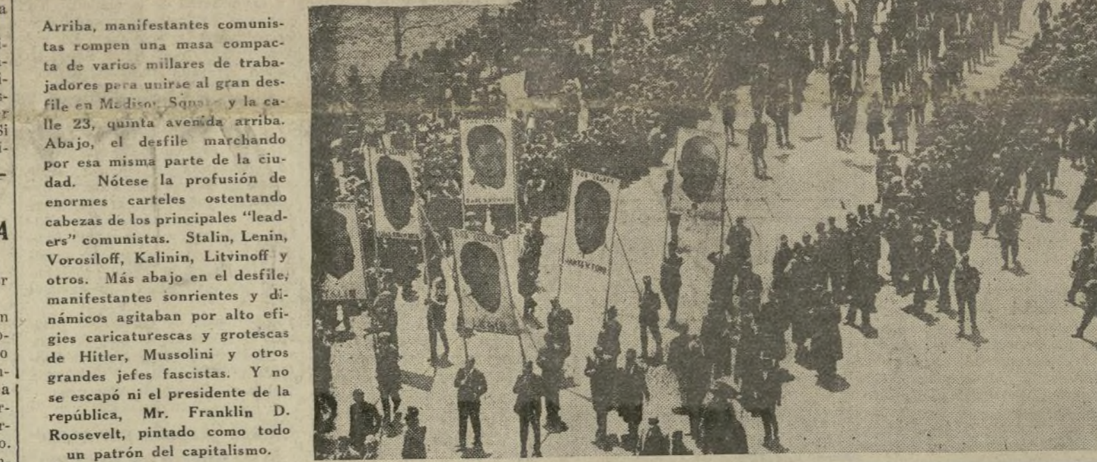
Arriba, manifestantes comunistas rompen una masa compacta de varios miles de trabajadores para unirse al gran desfile en Madison Square y la calle 23, quinta avenida arriba. Abajo, el desfile marchando por esa misma parte de la ciudad. Nótese la profusión de enormes carteles ostentando cabezas de los principales "leaders" comunistas. Stalin, Lenin, Vorosiloff, Kalinin, Litvinoff y otros. Más abajo en el desfile, manifestantes sonrientes y dinámicos agitan por alto efígies caricaturescas y grotescas de Hitler, Mussolini y otros grandes jefes fascistas. Y no se escapó ni el presidente de la república, Mr. Franklin D. Roosevelt, pintado como todo un patrón del capitalismo.