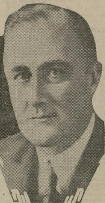
Presidente Franklin D. Roosevelt

El secretario Ickes dijo que se formularían "muy pronto" nuevos reglamentos para la administración de obras públicas, en reemplazo de los actuales. No pudo declarar, sin embargo, cuál sería