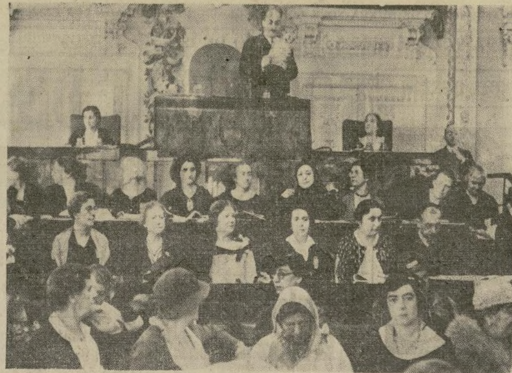
Delegadas de treinta países que asistieron al décimo-séptimo congreso de la Alianza Internacional de Mujeres, escuchan un discurso del alcalde de Estambul durante la sesión celebrada en el Yildiz Kiosk, palacio de los anteriores amos de Turquía.