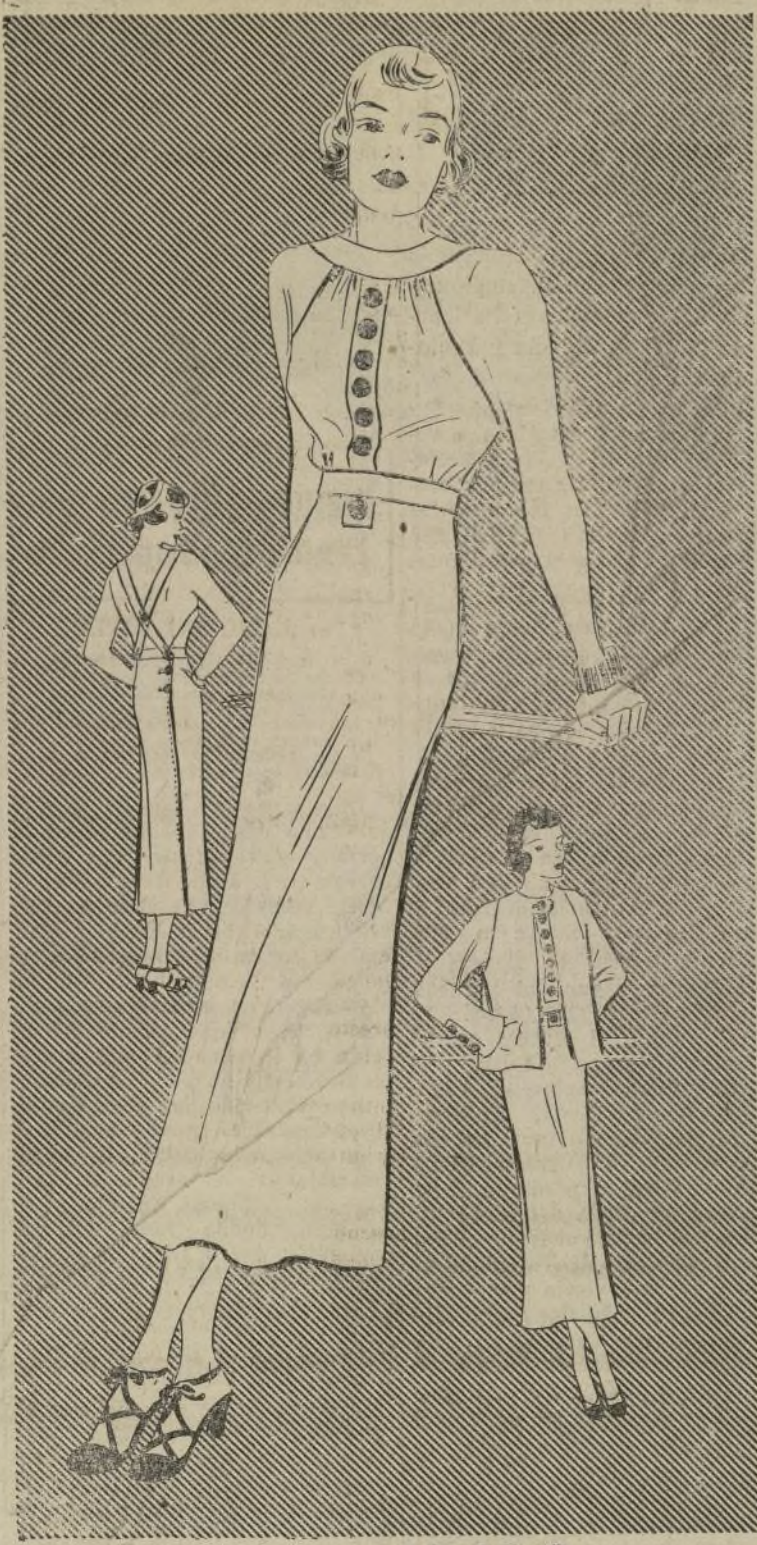
VESTIDO DESCOTADO CON CHAQUETA SEPARADA

1649-B.—El modelo que ilustramos hoy de espaldas escotada es propio para tomar baños de sol, y no debe de faltar en ningún guardarropa de verano. Además, tiene la ventaja de que puede usarse para la calle con chaquetas contrastantes. La que incluimos con este traje es sumamente elegante. Este traje se puede interpretar en seda, hilo, algodón y crepé sintético. La falda es angosta, de silueta recta y de un largo de 12 pulgadas del suelo, correcto para usar con zapatos de tacón bajo. La parte posterior de la falda tiene un pliegue que la hace amplia suficiente. Los tirantes de la espalda mantienen el vestido siempre cerrado. Los fruncidos del escote lucen muy atractivos en los vestidos de este estilo. Estos están sujetos al cuello que se une a la parte posterior a los tirantes. El único adorno del traje consiste en la banda del frente con una hilera de botones de color contrastante.