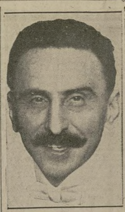
Don Melquiades Alvarez

La mayoría de los leaders han afirmado su anterior opinión