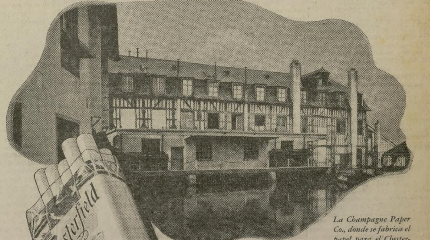
La Champagne Paper Co., donde se fabrica el papel para el Chesterfield.

Repetidas veces se hierven y lavan las trizas de puro lino, antes de ser laminadas en hojas frágiles de papel y cortadas en rollos para liar los cigarrillos Chesterfield.