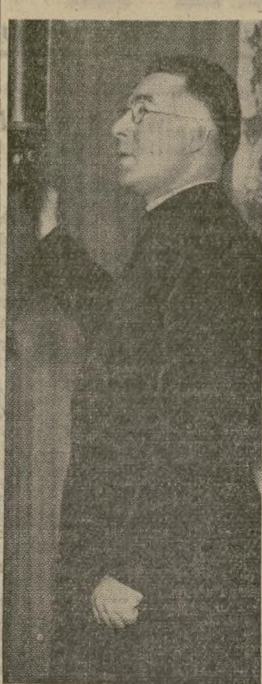
El padre Charles E. Coughlin quien, por medio de sus discursos por radio en los cuales ha discutido el aspecto económico del gobierno de Estados Unidos ha logrado un número considerable de seguidores. Aquí aparece apelando al pueblo para que éste pida la aprobación del proyecto de ley Patman para el pago del bono.