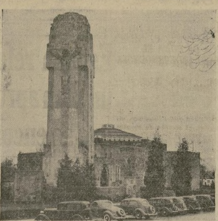
La iglesia de "Little Flower" en Royal Oak, Mich., la cual empezó como una pequeña capilla por el padre Charles E. Coughlin y que hoy día está casi terminada. El mencionado sacerdote transmite sus discursos desde un estudio que se encuentra en la parte alta de la torre.