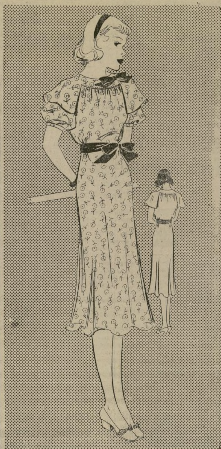
MODELO DE VESTIR PARA JOVENCITA

1597-B.—Esta temporada aparecen tan elegantes las hijas como las mamás, en los nuevos vestidos estampados de materiales delicados. Los últimos modelos de esta genérica que se considera grande, son de estilos muy femeninos y a la vez sumamente elegantes. El diseño que ilustramos reúne todas las cualidades que le dan un aire de sofisticación a la damita que lo use, sin sacrificar el buen gusto. Los fruncidos que están unidos al canesú tan gracioso suavizan la sencillez del traje, además éstos son necesarios en los vestidos de niñas que todavía están creciendo. Este modelo puede interpretarse con o sin mangas, ya que tiene las capitas que caen graciosamente sobre éstas. La falda está ligeramente acampanada y terminan el traje el alito del cuello y el del cinturón. Este vestido es propio para usar cuando los vestidos de jugar