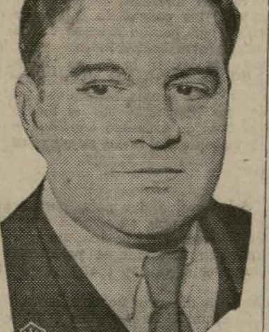
Fiorello H. La Guardia

si se consideraran a ellos mismos como los individuos destinados a gobernar eternamente esta tierra y parece además que creen que la constitución no fué escrita con