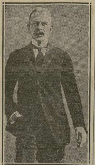
Presidente Oscar Carmona

El pueblo portugués fué convocado en diciembre pasado a vo-