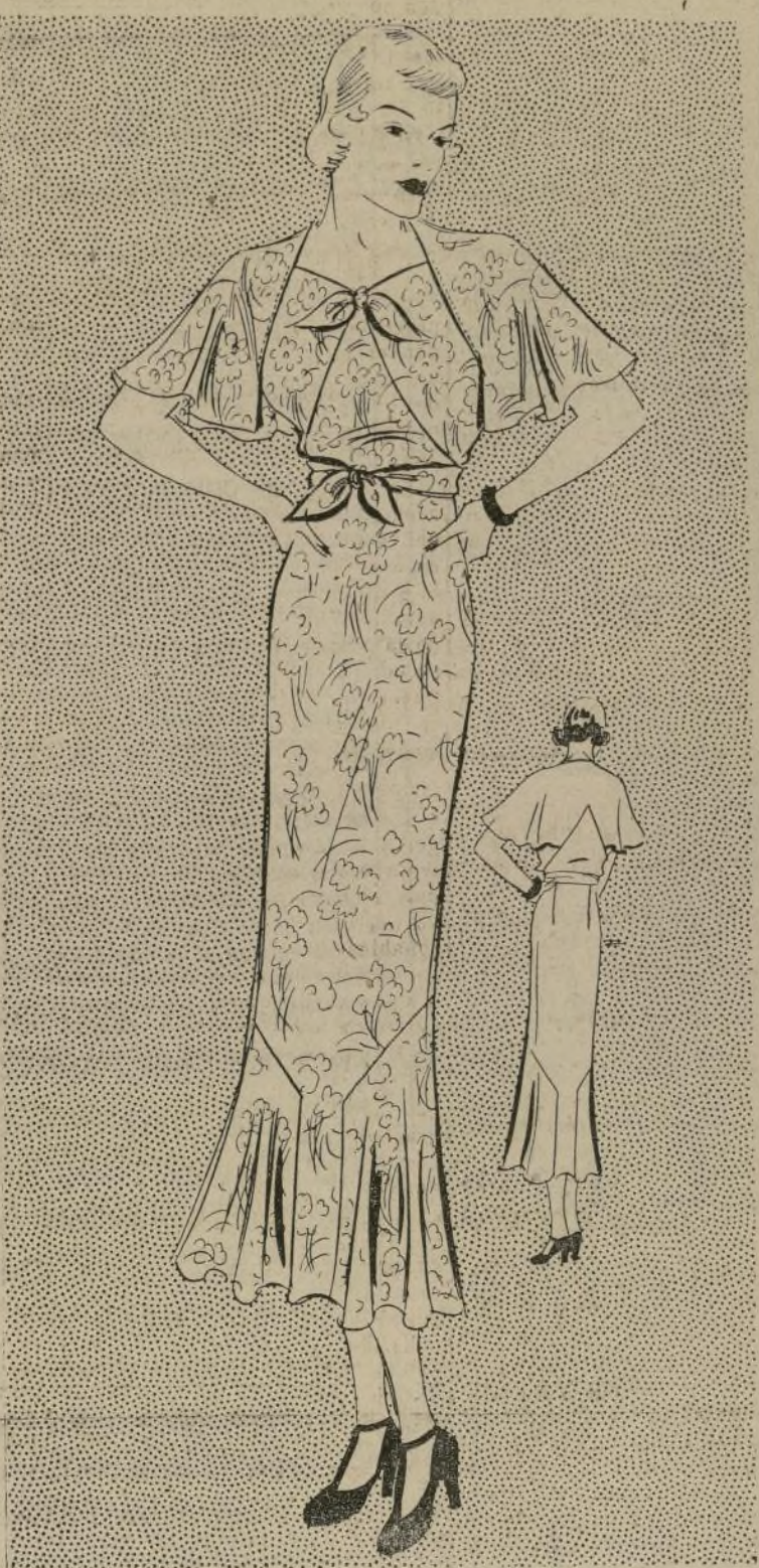
VESTIDO DE TARDE DE LINEAS MUY SENTADORAS