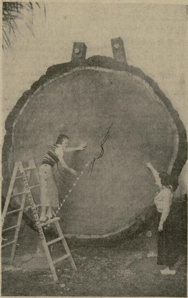
Una sección transversal de un gigante pino californiano del bosque nacional de Sequoia llega al palacio de Historia Natural de la Exposición de California en San Diego. El tronco tiene 12 pies de diámetro.