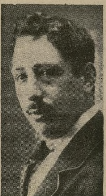
Don Luis Companys

MADRID, mayo 27. (A).—El juicio de la Generalidad de Cataluña, por la rebelión de octubre, comenzó hoy, ante el Tribunal de Garantías, en el edificio del Tribunal de lo Contencioso. Los acusados y sus consejeros, ante el Tribunal de Garantías. El fiscal pide para todos prisión perpetua. Companys aparece agotado por la reclusión.